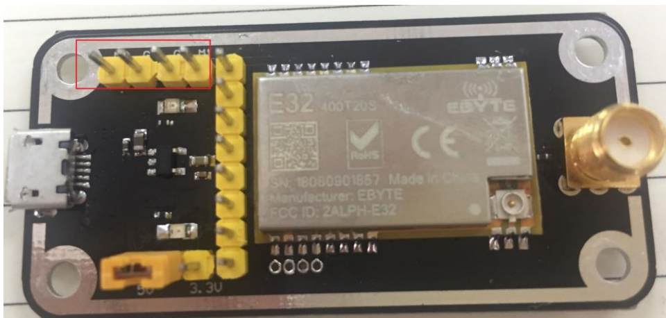
如图所示，插接好跳线帽（选择 5V 供电，模式 3），具体功能请参相应的串口模块手册。