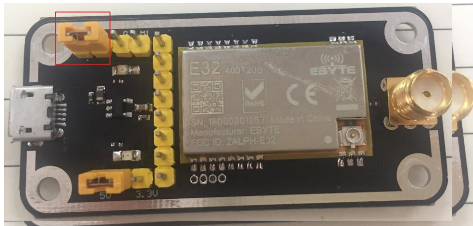
如图所示，插接好跳线帽（选择 5V 供电，模式 2），具体功能请参相应的串口模块手册。